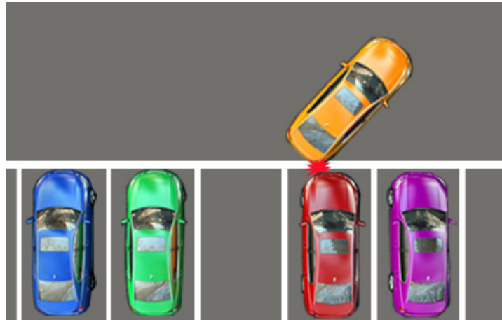
Zu nah am kurveninneren, rechten Fahrzeug: