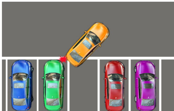
Zu nah am kurvenäußeren, linken Fahrzeug: